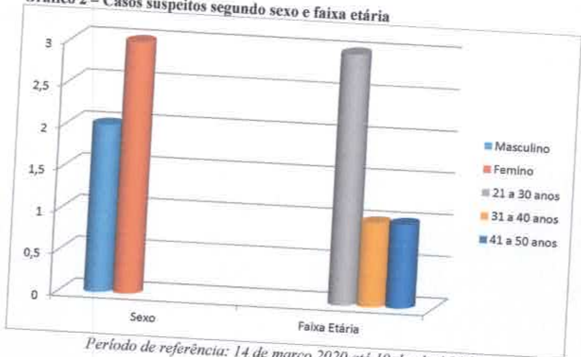
Gráfico 2 – Casos suspeitos segundo sexo e faixa etária

Período de referência: 14 de março 2020 até 19 de abril 2020.